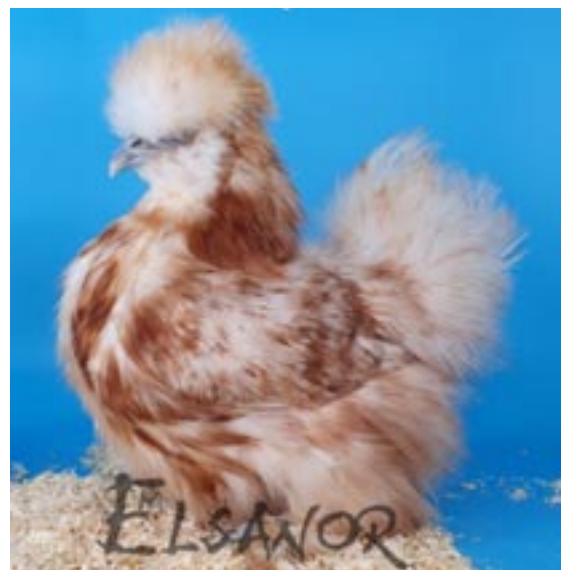
Poule soie blanc panaché rouge