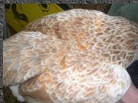
saumoné avec liseré clair