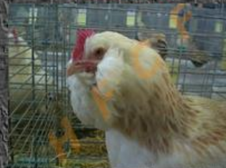
saumoné avec des aiguillettes brunes (mais pas noires)