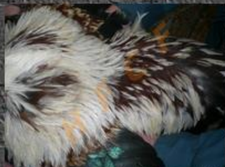
rougeâtre et couvertures des ailes brun rougeâtre