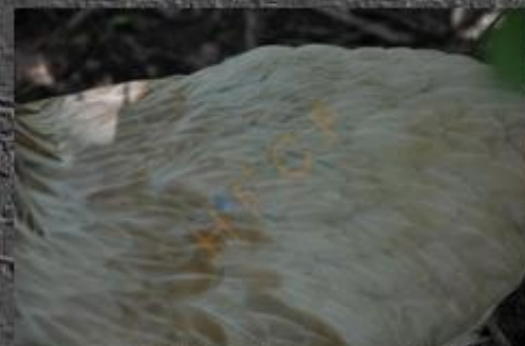
saumon clair uniforme