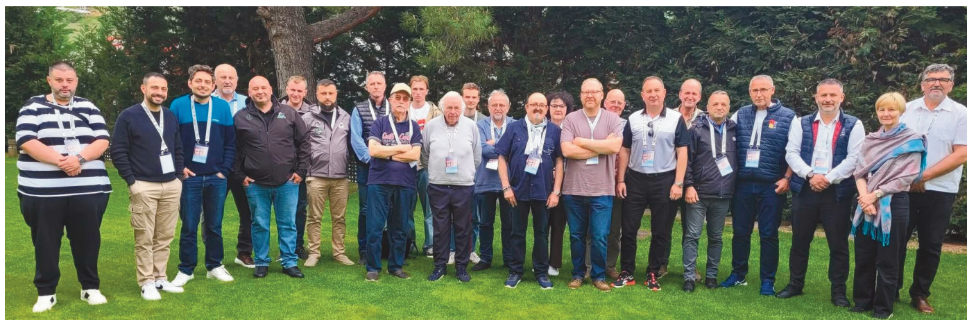
Le groupe des participants à la réunion