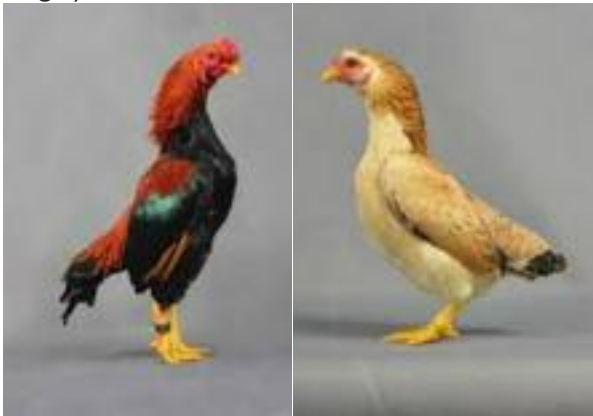
Couple de Tosa Chibi

Tosa Chibi (froment, sauvage, brun sauvage) a déjà été présenté à Metz en 2015, mais avec trop peu d'animaux. Il existe un standard qui sera remis en forme (ainsi que la description du brun sauvage) avant une éventuelle admission.