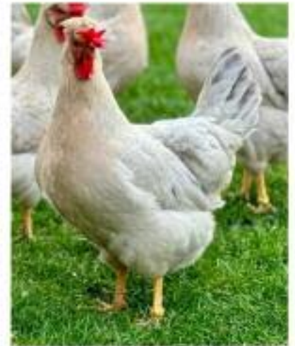
Poule Legbar huppée saumon coucou gris perle doré