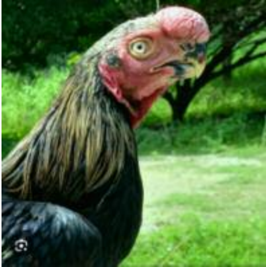
Asil à bec de perroquet