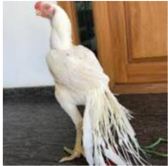
Shamo à cou tremblant (à la manière du pigeon trembleur de Stargard)

Prochaine réunion de mars de la CES-V : 20 au 22 mars 2026, de nouveau à Pohlheim.