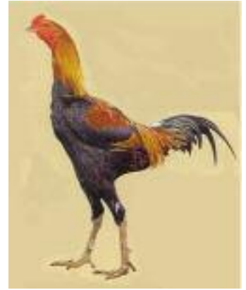
Combattant nain du Palatinat

Les Combattants nains du Palatinat sont donc reconnus dans différentes couleurs.