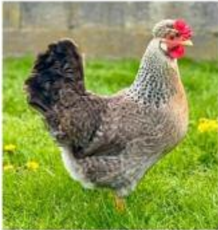
Poule Legbar huppée saumon coucou doré clair

En France, il y a un club de la Legbar huppée (24 adhérents pour l'instant). On ne sélectionne que les variétés huppées pondant des œufs bleus (voir ci-dessous)