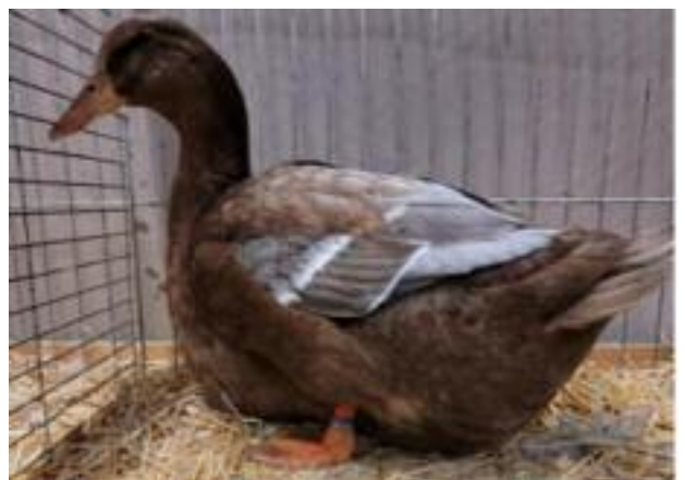
Le canard de Rouen anglais, exposé à Erfurt (Allemagne)

• À l'exposition d'Erfurt (Allemagne) : un canard de Rouen anglais « penchait en avant ». Position très limite. Rappel : selon le standard, le ventre ne doit pas toucher le sol.