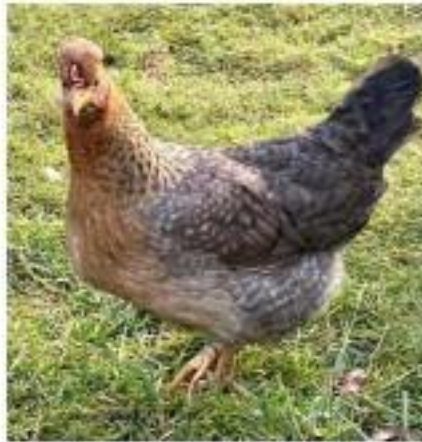
Poule Legbar huppée saumon coucou doré