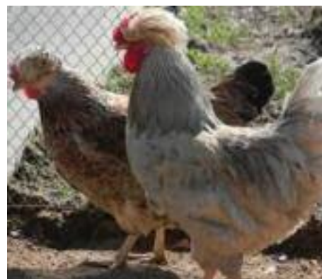
Gugullu de Trabzon

Et puis il y aura certainement aussi les Gugullu de Trabzon, qui sont encore extrêmement différents dans leur type et ne peuvent